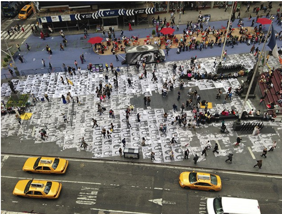
뉴욕 타임스퀘어 인사이드 아웃 프로젝트 광경

12. 야외에 붙는 관계로 날씨 사정에 의하여 자연적으로 포스터가 떼어지게 됩니다. 혹시 자신의 얼굴 사진이 찢어지는 것을 원하지 않으시면 신청을 취소해주세요.(하단 참고)